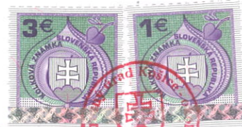
foto rozhodnutie nadobudlo právoplatnosť dňa 5. 4. 2014 V Košiciach, dňa 7. 4. 2014 Podpis: _____